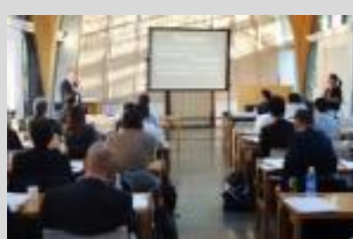
2019年11月には、認定者を中心とした、事例検討会も開催された (東京大学 弥生講堂アネックス)

スポーツ・コンプライアンス・オフィサーの活動状況については、編集工房ソシエタスのホームページ内Athlete-Societas:「スポーツ・コンプライアンス教育の充実に向けて」で紹介されています。