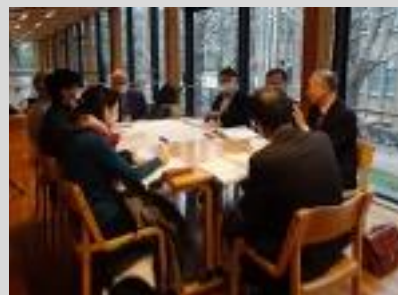
第2回 2020年2月29日(土) 3月1日(日) グループワークの光景