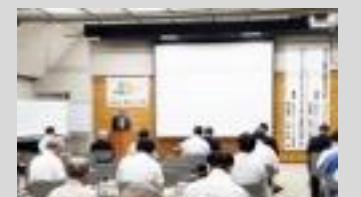
長野市スポーツ協会 インテグリティ研修会(長野県)