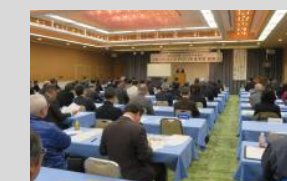
岩手県体育協会 スポーツ・インテグリティ推進事業 研修会(盛岡市)