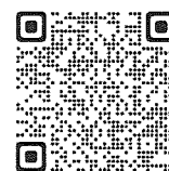
ライセンス制度について